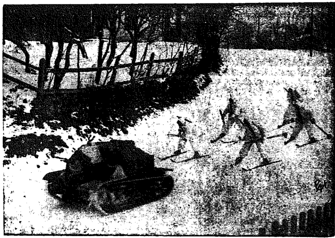
MANEWRY ZIMOWE. W miesiącu bieżącym w okolicy Kolomyj odbyły się zimowe manewry wojskowe dla przedstawicieli państw obcych. Na zdjęciu z lewej strony — ciężki karabin maszynowy na stanowisku. Zdjęcie z prawej strony przedstawia przemarsz piechoty na nartach, ciągniętych przez czołg.