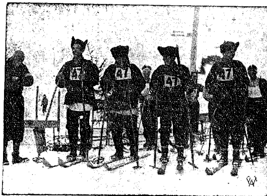
Huculi — narciarze. Grupa Huculów, uczestników rajdu narciarskiego p. n. Szlakiem Drużej Brygady Legionów.