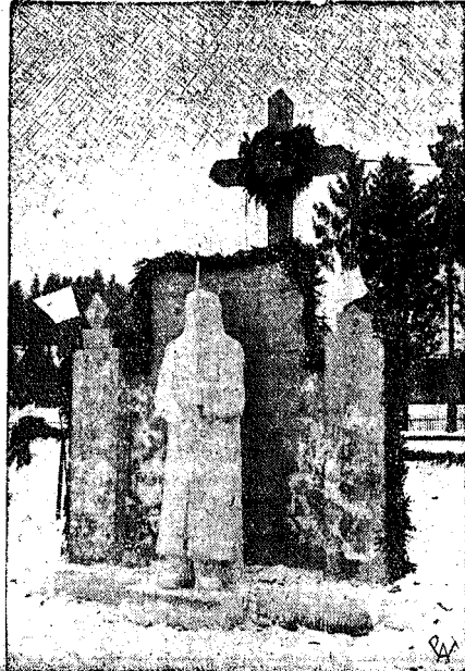
Świato sportowe w Worochele. W czasie trwania marszu Szlakierń Drużej Brygady Lekkich Worochele ozdobiona byłakłmami figurami ze słęgu, wykonanemi przez artystów rzeźbiarzy. Na zdjęciu — jedna z figur przedstawiająca żołnierza na warcie.

Wilno. — Na podstawie materiałów ujawnionych ostatnio u zatrzymanych działaczy komunistycznych partji za chodniej Białorusi stwierdzono że partja ta zdołała rozszerzyć swe wpływy na młodzież akademicką w Wilnie. Przy zbadaniu tych materiałów wyszło na jaw, iż na terenie uniwersytetu Stefana Batoro w Wilnie od 1932 r. akcja komunistyczna była realizowana przez utworzenie i wykorzystywanie organizacji pomocniczej pod nazwą „lewica akademicka-front”, posiadającej swe nielegalne koła na poszczególnych wydziałach uniwersytetu Stefana Batoro i pozostającej w łączności z organizacją studentów żydowskich p. t. „Funk”. W 1934 r. wydano nielegalny „Manifest frontu”, oraz pismo „Zew”, a w styczniu 1935 r. pismo „Nasza walka”, zawierające w treści programowe hasła komunistyczne. Dla stworzenia podstaw ma sowej akcji, a przedewszystkiem dla zdobycia wpływów na młodzież akademicką, spisek komunistyczny między in. roztoczył działalność, mającą rzekomo na celu obronę praw niezamożnej młodzieży akademickiej. Akcja organizacji w ostatnich czasach zwróciła uwagę władz i na zarządzenie prokuratora zatrzymano wiele osób. Z nakazu władz 9 osób z spośród zatrzymanych osadzono w więzieniu.