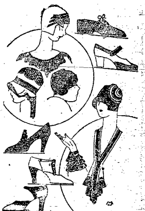
Modne kapelusze, obuwie i zaboty.

czarne z białym, nazywane strassa mi. Dopuszczalne jest wydłużenie cyryla z tytu - niemal obowiązujące w tuletach balowych. Ale o nich mówić tutaj byłoby jeszcze nieco przedwczesnie.