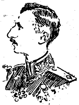
Król węgarski Borys w tych dniach obchodził 10-tą rocznicę wstąpienia na tron.