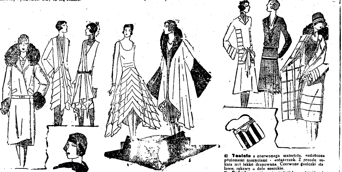
1) Wielki płaszcz o ciemno-czerwonym welouru, kołnierz i mankiety z brązowego tkaniny umieszczone są wysoko. 2) 3) Dwie toalety, których krawężnice się linie na przedzie - nadaje bardzo elegancki wygląd. Wzrost sukienki jest z welouru barwy beige, druga - z niebieskiej satyny.