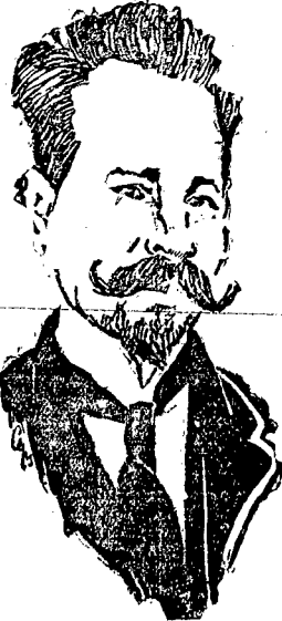
Prezydent Litwy, Smetona, który na czystości otwarcia szkoły oficerskiej w Kownie wygłosił wielką mowę polityczną, podkreślając, że na świecie nigdy nie będzie wieczystego pokoju, a bez niego nie ma pokoju.

Chorzy mają mieć wolny wybór lekarza, tj. prawo leczenia się u lekarzy, należących do Kasy Cho-