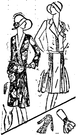
3) Elegancka sukienka z jedwabnego satyna lub drukowanej tkaniny...