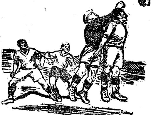
Mecz piłkarski na Olimpiadzie w Amsterdamie. Momentalny szkieł z zawodów w piłkę nożną pomiędzy drużynami Francji i Włoch.