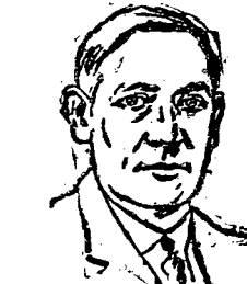
Jan Wils, budowniczy stadionu na Olimpiadę w Amsterdamie.

(X) Reorganizacja władz lotniczych we Francji. Francuska Rada Ministrów debatowała nad nową organizacją władz żeglugi powietrznej. Członkowie gabinetu wyrazili życzenie, by zarówno lotnictwo wojskowe, jak i komunikacyjne, podporządkowane zostało jednemu kierownictwu. Następnie zastanowiono się nad formą nowej władzy zwierzchniej, przyczem wysuwano projekt utworzenia komisji, podsekretarjatu stanu, a nawet oddzielnego ministerstwa. Prezes Rady Ministrów Pomcare, który dotychczas był przeciwny stwarzaniu nowego ministerstwa ze względów polityki skarbowej, obecnie wyraził się zgodę. Spodziewać się należy, że sprawa organizacji nowych władz lotniczych zatwierdzona zostanie de facto w przeciągu 2 — 3 tygodni. Ze względu na okoliczność, iż ilość istniejących ministerstw zatwierdzona jest ustawą, sprawa opóźnić się będzie musiała o parlament, który musi zezwolić na stworzenie nowego ministerjum. Jako najpoważniejszego kandydata na przyszłego ministra lotnictwa, wymieniają dawnego podsekretarza stanu Laurant-Eynac, który ustąpił w sierpniu 1926 roku po zniesieniu podsekretarjatu stanu.