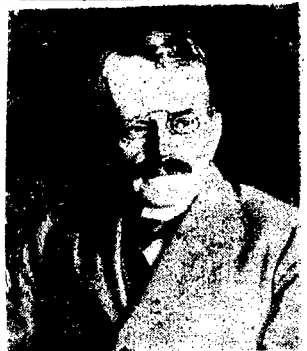
Po zamknięciu Wystawy Sztuk Dekor. w Paryżu.

scher Courier sprostowanie, w którym wyjaśnia, że właśnie wstąpienie Niemiec do Ligi Narodów, a temsamem uzyskanie stałego miejsca w Radzie Ligi może skutecznie przyczynić się do złagodzenia postanowień wpływających z art. 164-go Traktatu Wersalskiego, a odnoszących się do rozbrojenia Niemiec.