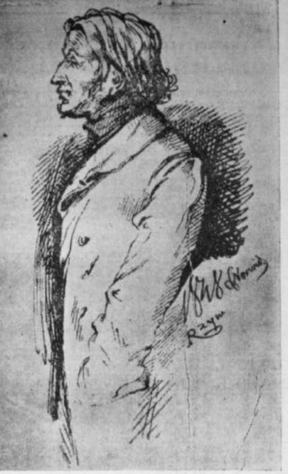
ADAM MICKIEWICZ Rysunek: Cyprylna Kamilla Norwida