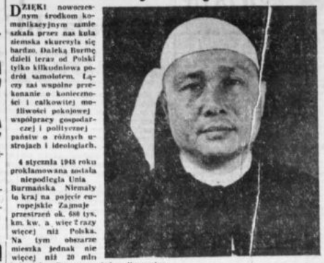
4 stycznia 1948 roku proklamowana została niepodległa U Nu. Burmańska Niemal była samostanowioną państwem. W tym czasie w Warszawie odbyła się konferencja, na której U Nu i premier polski Józef Cyrankiewicz podpisali porozumienie o przyjaźni i współpracy. W tym czasie w Warszawie odbyła się konferencja, na której U Nu i premier polski Józef Cyrankiewicz podpisali porozumienie o przyjaźni i współpracy.