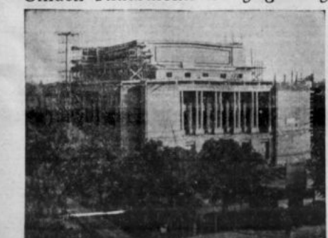
Filharmonia Pomorska w Bydgoszczy gotowa już jest w stanie surnym. Do 1956 koncerts gmachu zostanie wykonany zgodnie z nim Orkiestra Pomorskiej Filharmonii (zobacz reportaż na str. 3).

laby współpracą obu części Niemiec: NRD i NRF.