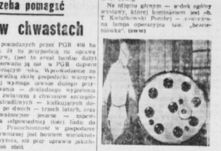
W polskim PGR... w polskim PGR...

W myśl instrukcji Ministra... Prawa jazdy wyminiemy do 30 hm... Wyminiemy do 30 hm...