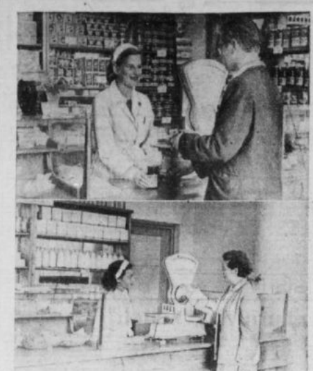
należy stwierdzić, że „setka” MHD przy ul. Nowowiejskiej jest tak samo dobrze zapracowana i „polska” w tym samym personal, jak w dniu otwarcia. Powyżej reprodukcję dwa zdjęcia, na nich dwa stoiska i dwie bardzo uprzejme ekspedientki. Blizsze szczegóły nieopisane — znacie je wszyscy doskonale.