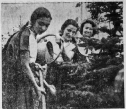
W Centralnym Parku Kultury wiedeńskiej przebrany tłum młodzieży Międzynarodowy Instytut Fizyki, arabie burun, kędzierzawe czupryny brzojskich i afrykańskich Murzynów, blond czupryny skandynawskie, barwne pasunki lotniskowców Wietnamu trzymają w rękach. hupaty Po co? — dla żartu małych dzieciaków, ledzących jeszcze pokolem wędlił parkowej alei — tłumaczył wszystko. Za chwilę rozpoczęło się siedzenie drzewek przyjeźdźców przed miastem całego świata.

Manifestację otworzy pochod młodzieży, który rozpocznie z Placu Zwycięstwa ulicą Krakowską, Marszałkowską do Placu Ślania, a po manifestacji na Placu Stalina odbędzie się zabawa ludowa.