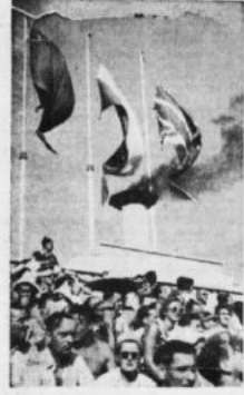
Podobnie jak w przedzień, na inauguracji V Światowego Festiwalu, tak i w poniedziałek niekiedy Stadion Dziesięciokrotny wypełnił ponad 80 tys. widzów. Amfiteatr na trybunach grają wszystkim kolorami wielobarwnych strojów, a na koronie stadionu wyklyły kolorowe baloniki z flagami 81 państw. Łopocą białe flagi z emblematami Igrzysk.

Zbliża się uroczysty moment rozpoczęcia największej tegorocznej imprezy sportowej na świecie — II Międzynarodowych Igrzysk Sportowych Młodzieży.