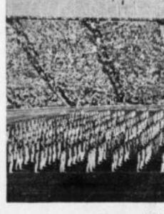
Stadion w czasie uroczystości otwarcia Igrzysk