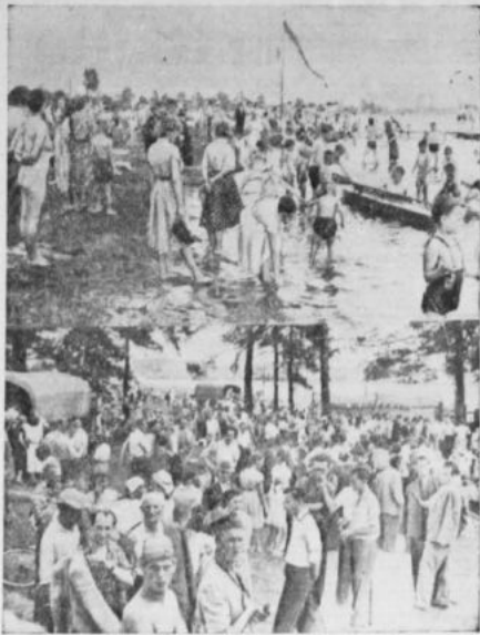
... tysiące częstochowian wyległy na plażę nad Jeziorem w Białoborniu, gdzie otwarto w okresie letniskowym Dr. Morza siodek sportów wodnych LPZ. Gdy tylko nastąpiła kapieć lub słońce kąkakiem, inni szturmem po plażę chłodzącą do dobrze zreszt zaprzęgniętych basenów.