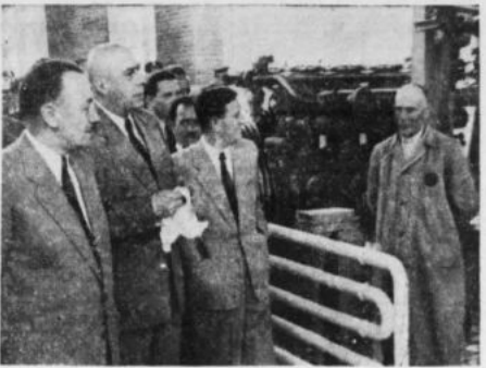
Bolesław Bierut i Józef Cyrankiewicz zaledzają Targi.