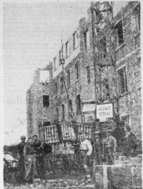
„odbudę się na budowach ZBM transportu cegły przy pomocy instalacyjnych kosiów... kontenerów. Cegła ładuje się do kontenerów w wagonach..."