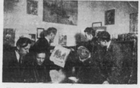
Wielu z młodych chłopców, zrzeszonych w pracowni plastyki MDK która prowadzi R. Szalacha, przejawia niekłamane urodzenie. Świadczą o tym bardzo udane prace graficzne i malarskie, papieroplastyczne rzeźbiarskie.