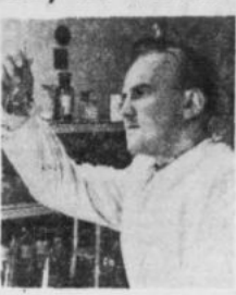
...nadaje się do picia? Pracownicy Miejskiej Stacji Sanitarno-Epidemiologicznej...