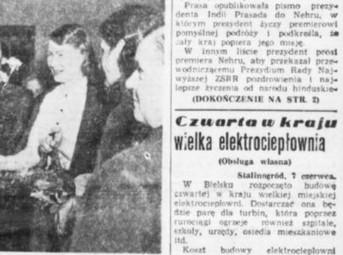
Uczestniczący Krajowej Rady Matek zostały w Anu 6.VI.55 przyjeżdżając przez Przewodniczącą Rady Państwa Aleksandra Zasadzką.