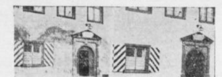
Z lewej — widoczne piony wilgoci na fasadzie domu. Z prawej — mimo wpięcia 3 lat po „zbioru” elektroosmotycznym wilgoć nie działa.

O szkodliwym działaniu wilgoci w mieszkalnictwie nie trzeba słowami przekonywać. Nierzadko ona zdrowie mieszkańców i same domy. Warto przypomnieć, że wilgoć zabija rośliny, niszczy tkaniny i wywołuje zamieszanie epok i zniszczenia w sztucznych materiałach, a także w metalach. Właściwie niekorzystne są także podłoża w stokuach do naturalnych wód gruntowych. Woda atakująca mury domu jest nie tylko szkodliwa, ale także niebezpieczna. Woda atakująca mury domu jest nie tylko szkodliwa, ale także niebezpieczna. Woda atakująca mury domu jest nie tylko szkodliwa, ale także niebezpieczna.