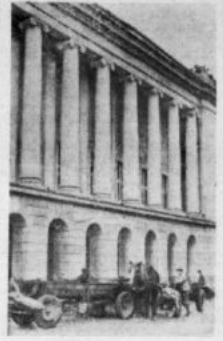
Przed koncertem gmachu Filharmonii od strony ul. Śienkiewicza robotnicy porządkują już jezdnię i układają chodniki.