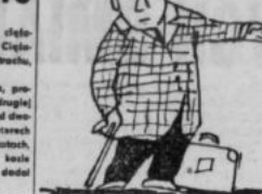
31 GRUDNIA 1954