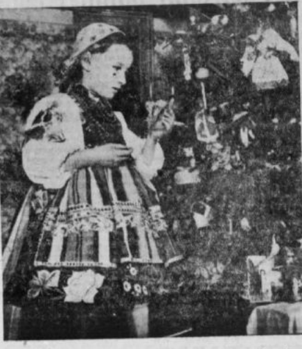
Patrzeć, jak gładzie wygląda kolo ustrojonej choinki dziewczynka w barwnym, lśniącym stroju. Wiele spośród imprez noworocznych urządzonych w ludowych, regionalnych strzechach, z inscenizacjami bajek, występami kukielkowym i t. d. Okres imprez noworocznych będzie trwał dość długo. Życzymy naszym najmłodszym wesołej, bestrudkowej zabawy.