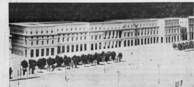
„Wschodnia ściana” pl. Stalina. Budynki środkowej — nad ul. Hłbrena — przeznaczony został na siedzibę Prezydium Stolecnej Rady Narodowej. Makieta według projektów prof. inż. arch. Jana Bogusławskiego.