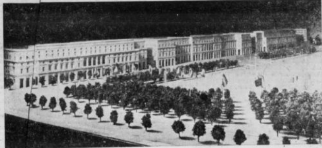
Projekt no. „wschodniej ściany” pl. Stalina — odcinek ul. Marszałkowskiej między ul. Świętokrzyską a Al. Jerozolimskimi przygotowany przez zespół „Miastoprojekt-Śródmieście” arch. Jana Bogusławskiego.