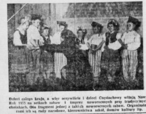
Dzieci całego kraju, a więc oczywiście i dzieci Czestochowskiego witaly Nowy Rok 1955 na strzechach i w imprezach noworocznych zabaw. Organizatorami ich są rady narodowe, kierownictwa szkół, domów kultury itp.