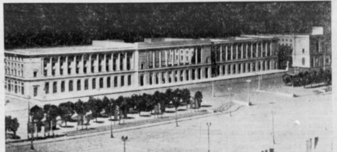
Środkowy odcinek „zachodniej ściany” pl. Stalina. Budynek „kolumnada” przeznaczony jest na siedzibę Prezydium Stolecnej Rady Narodowej. Makieta według projektów inż. arch. Jana Knothe i inż. arch. Zygmunta Stepińskiego.