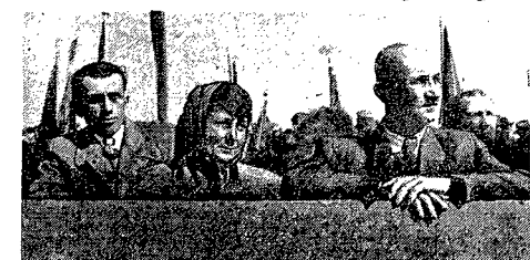
Przed kilku dniami młody zastęp oficerów politycznych — synowie robotników i chłopów — saszki kadry Wojska Polskiego. Państwo Ludowe kieruje ich do odpowiedzialnej pracy wychowawczej wśród żołnierzy.

W uroczystości promowania oficerów wzięły udział delegacje władz państwowych, przedstawiciele władz partyjnych, przedstawiciele wojska, delegacje organizacji społecznych oraz rodzice nowopromowanych.