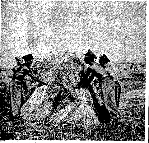
Zolnierze jednostek WP, przebywajacy na letnich obozach wyszkoleniowych, pomagali w zniwach majacym PGR-om, spedzajacym produktynym i chiopom. Dla wiekszej zolnierzy pracy w polu nie jest zadnym nowoscia, gdz w rodzinnej wsi prawie kazdy juz nieraz brat udzial w zniwach. A tych, ktorzy przysiechali z miasta, kolezdy szybko czu waznosc snopow na polach PGR Gruda (na zdjeciu).

W POLOWIE roku 1942, w kilka miesiecy po wiazaniu na Filipinach hord militarystycznej Japonii, mieszkajacy Manill utrzymali polajac sie w tajemniczy sposob na murach domow i na stajkach odzwoy, podpalac przez filipińskie partyzantki i organizacje hukabehaj, co w przekladzie oznacza „Ludowa Armia Antyjaponska”. Przywodca tej organizacji byl Luis M. Taruc. Japoncy zagrabili Batan, nastepnie zas Coregidor. Mac Arthur i czlonkowie rzadu filipińskiego uciekli z Filipin. Ale opór wobec zbiorow Japoniskich wzniesl sie w wyspiarskiej hukabehaj pod przywodztwem szacunkiem i budzic nadzieje w sercach patriotow.