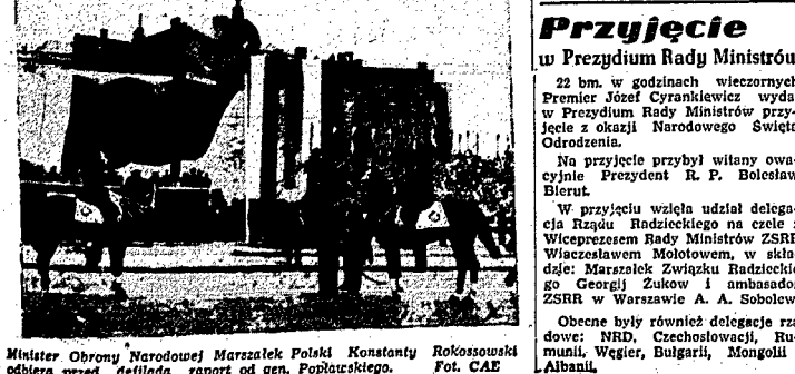
Minister Obrony Narodowej Marszałek Polski Konstanty Rokossowski odbiera przed defladą raport od gen. Popłazkiego.

Naród nasz w siódmą rocznicę odrodzenia Polski, naród, który tyle zapłacił i wysiłku i swojej niepoprzętej żywotności władze w dieło budowy szczególnej przyszłości, do szczególnej radości i dumy wita defilującą dziś na ulicach Warszawy, odkryła chwiałą zwycięskich zmagają z hitlerowskim iá zwycięstwa niezapomnianym braterskimi broni Armii Radzieckiej — Odrodzone Wojsko Polskie. Wszystkim żołnierzom, oficerom i generałom Wojska Polskiego życzymy dziś gorące pozdrowienia i życzenia, aby pod dowództwem walecznego syna Warszawy, bohatera Stalingradu, Marszałka Polski Rokossowa, rozwijać dalej swoje zwycięstwa bojowe i obywatelskie, stanowić mocne ogniwo iá, stolarskich