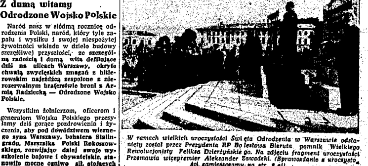
W ramach wielkich uroczystości Święta Odrodzenia w Warszawie oddano- niej został przez Prezydenta RP Bolesława Bieruta pomnik Wielkiego Revolucyjnego Feliksa Dzierżyńskiego. Na zdjęciu fragment uroczystości Przemawia wicepremier Aleksander Żdanowski. (Sprawozdanie z uroczysto- ści zamieścimy na str. 2.ej)

Minister Obrony Narodowej Marszałek Polski Konstanty Rokossowski odbiera przed defladą raport od gen. Popłazkiego.