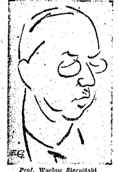
Prof. Wacław Sierpiński