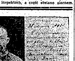
Fotografia z protokołu, sporządzonego przez carską komisję wziętą przed wystąpieniem Dzierżyńskiego na Sybir...