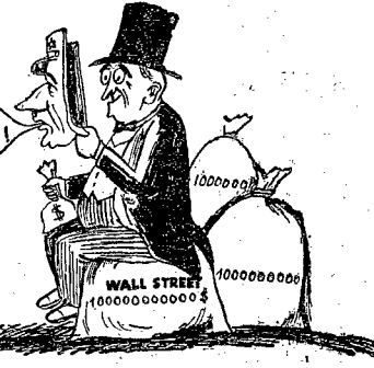
KANDYDAT DO WŁADZY

Gos. do BiBiSi prowadzi demagogiczną kampanię wyborczą w Francji (o prasy)