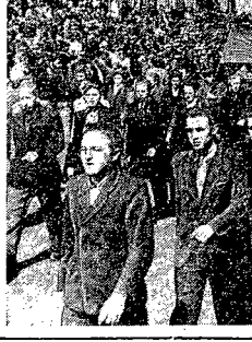
Wielki Plebiscyt Pokoju. Na zdjęciu przedstawiono uczestników plebiscytu, którzy wyrażają swoje stanowisko na temat wojny i pokoju.