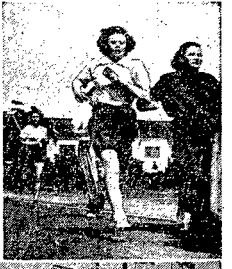
Na zdjęciu dołym - defilada robotników z Muranowa przed startem, u góry - pierwsze zawodniczki kończą bieg.

Dn. 18 bm. w całym kraju odbyły się Biegi Narodowe, połączone ze zdobywaniem norm na odznakę SPO. W Warszawie odbył się pierwszy etap zawodów, w którym startowali sportowcy zreszenia Budowlani.