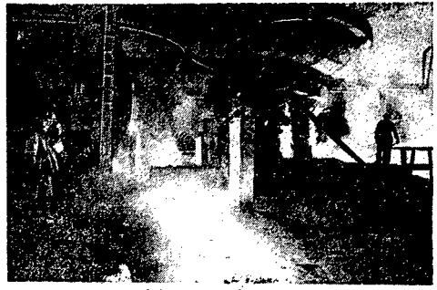
Kombinat metalurgiczny im. Stalina w Magnitogorsku. Oddział hutniczy. Do korespondencji obok.