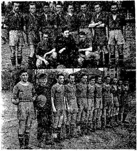
Ognio w postaci łez i utalentowane młode kadry pilkarskie. Oto dwie drużyny rezerwy, z których w przyszłości wyłoni się na pewno nie jeden talent bolszowski.