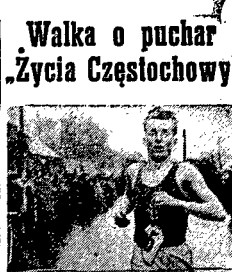
Przy rekordowym udziale 117 zawodników i zawodniczek odbył się V Ogólnomiastowy Bieg Uliczny o puchar prezydenta naszej Redakcji.

W powstaniu naukowych ekonomistów katowickich i częstochowskich nie zna całej odpowiedzialności wyrazu najłagodniejszego, a w ich ramach zarówna kolejni i transport. Na usprawiedliwienie ekonomistów częstochowskich trzeba dodać, że z tymi problemami, profesorowie WSE ześknęli się bezopinie niepełny rok temu, tj. od czasu przyłączenia Częstochowy do województwa katowickiego.