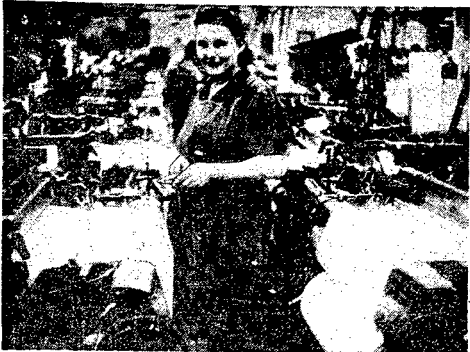
Wśród zobowiązań polskiej klasy robotniczej, podjętych przed świętem... Wśród zobowiązań polskiej klasy robotniczej, podjętych przed świętem...