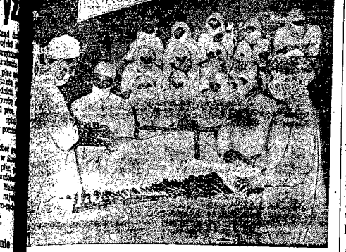
Amerykańskie władze okupacyjne Niemiec zachodnich zwolnily i zwolnily... (Text describing the release of prisoners and medical staff in occupied Germany)