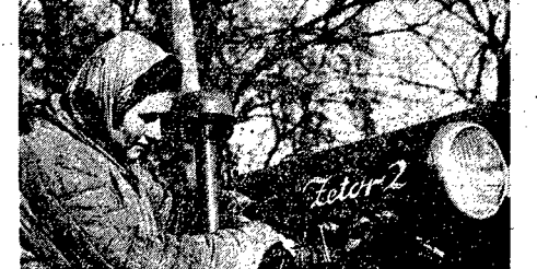
Razem z setkami milionów kobiet na całym świecie, kobiety polskie świętują 8 m. Międzynarodowy Dzień Kobiet, podejmując zobowiązania... (Caption text is partially obscured and repetitive in the original image)