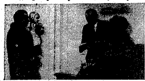
Potęźny orzeź w walce z biurokracją i bezdziałnością niektórych urzędów...