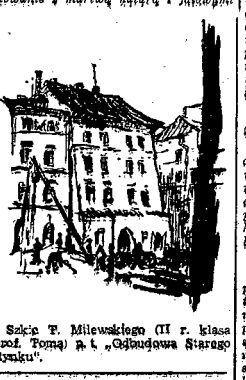
Szkic F. Milewskiego (II r. klasa...)

analizami kolorystycznymi. Motywem... najczęściej spotykanym w pracach stu-