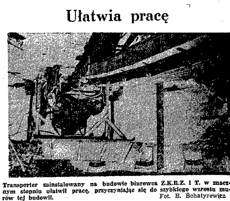
Transporter zainstalowany na budowie biurowca Z.R.R.Z. i T. w znacznym stopniu ułatwił prace, przyspieszając je do szybkiego wzrostu murów tej budowl.