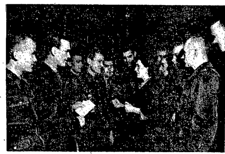
Wybitni robotnicy i racjonalizatorzy spotkali się w sali Klubu Oficerskiego z weteranami żołnierzy, omawiając sukcesy zwycięskiej walki...