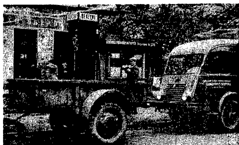
...to swego rodzaju dowód wzrostu motoryzacji. Częstochoyskie stacje CPN dobrze wywiązują się ze swych zadań.