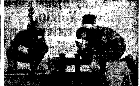
W Porcie Czarniakowskim, w okresie zimy, tabor rzeczny poddawany jest gruntownemu przeglądowi i remontowi...