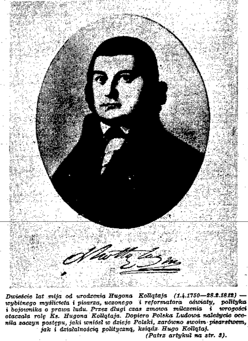
Dziesięć lat mija od urodzenia Hugona Kołłataja (1.1.1870-28.8.1928) — wybitnego publicysty i pisarza, uczonoego i reformatora oświaty, polityka i bojownika o prawa ludu. Przez długi czas zmowa milczenia i wrogoci osłabła rolę E. Hugona Kołłataja. Dopiero Polska Ludowa należała do ocalałych zarysów postępu, jaki uniósł w dzieje Polski, zarówno swoim piarstwem, jak i działalnością polityczną, księga Hugo Kołłataja. (Patrz artykuł na str. 5).