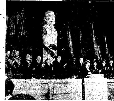
Przemówienie w Warszawie 11. grudnia 1949 r. w sprawie 70 rocznicy urodzin Józefa Stalina.