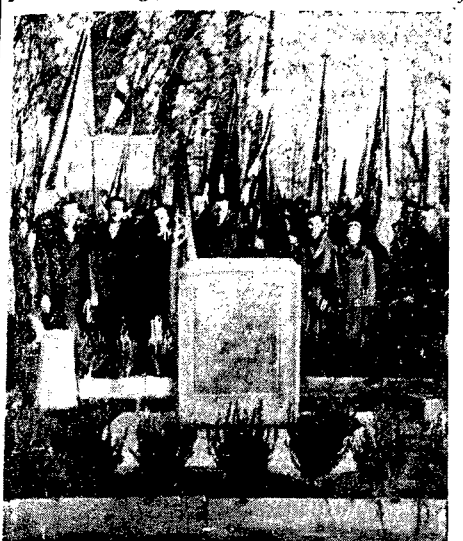
Spółnie z uchwałą Komitetu uroczono 70 rocznicę urodzin J. Stalina... w formie połonki kamienia wizerunku pod pomnikiem Przyjaźni Polsko-Radzieckiej...