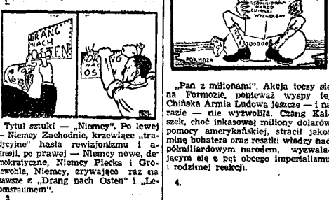
Tytuł sztuki - „Niemy”. Po lewej - Niemy Zachodni...