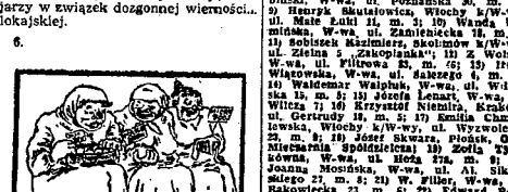
„Pan z miłoniem”. Akcja toczy się na Formozie...