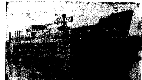
Kadlub 3-go rudobawczego s/a „Brzgała Młakowskiego” przed wodami.