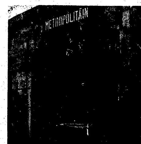
Scenariusz ścieżki w paryżu, strajk fabryk, kolej, tramwaje, strajk objął wszystkie działy życia. Na zdjęciu: zamieszanie kolej podmiejskiej w Paryżu.