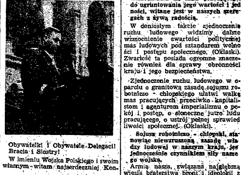
Obywateli i Obywatle Delegaci! Brać i Siostry!

Nova burza okłasków szrywa się gdyż na trybunie wicemarszałek Marszałek Polki, Minister Obrony Narodowej RP, Konstanty Rokossowski. Marszałek Rokossowski mówi: