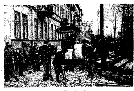
Robotnicy Wydziału Drogowego Zarządu Miejskiego przy pracy nad odfenowaniem nowej jezdnii przy ul. Kilińskiego... Nowa jezdnia przy ul. Kilińskiego w Częstochowie. Nowy odcinek od ul. Dąbrowskiego do ul. Kilińskiego. Znikną w ryzy i „kocie łby”, w które obfitywała na wspomnianym odcinku.