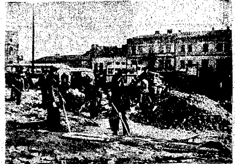
Ludność Częstochowy pracuje przy odgruzowaniu getta. Dzielki ochotniczej pracy mieszkawców misła znikają powoli gruzy w tej dzielnicy.