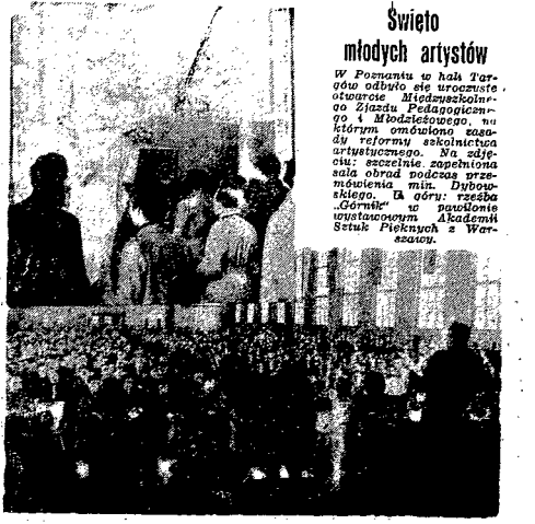
Święto młodych artystów w Poznaniu w halach Ogrodów odbyło się w czwartek 24 października 1949 r. W tle widoczny jest jeden z wystawców, a w pierwszym planie jeden z artystów.