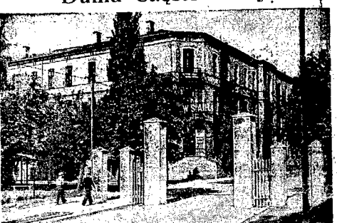
Wejście do gmachu WSAH, mieszczącego się w b. Koszarach Zawady. Za trzy lata ulegnie przeniesieniu się do własnego gmachu. — Na pierwszym planie budynek Instytutu Psychotechnicznego.

bardzo krótki, gdyż lokal musi być przystosowany do potrzeb szkoły i internatu oraz wyposażony w odpowiedni sprzęt. A w miarę jakimi tradycjami szpitali, jeśli chodzi o robotników, należy przystąpić do budowy. Należy zatem energicznie zabrać się do renowacji obiektu dla oddziału odczynu szpitala. Jeśli Zarząd Miejski przystąpi ze swoją energią do sprawy, to budynek szpitala będzie do dnia 1 listopada odremontowany. Licytacja w interesie miasta, które uzyska wykwalifikowane sily pielęgniarstwa o zdecydowanie pozytywnym obliczu ludowym, uniejędźni odpowiednio podjęcie do chorego robotnika czy chłopca. Szkoła Młodszych Pielęgniarek będzie w okresie sześciomiesięcznym wypuszczac po 60 pielęgniarzek przygotowawczych fachowo i nastawionych społecznie do swego zawodu. Do szkoły będą przyjmowane dziewczęta po ukończeniu 7 klas szkoły podstawowej (w tym czasie odbywa się kurs 17 i 18 lat do 35 lat, z rodzin robotników, chłopów i inteligencji pracującej. Ze wsi do tej szkoły będą kierowane dziewczęta z poprzec Stronictwo Ludowe, Gmin