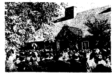
Wieloletni zespół szpitalny, w którym walczyli z Chłepcą, wystąpił 700-000-bolny chor Chłepcą Mieszkańców pod dyr. Lechmanem.