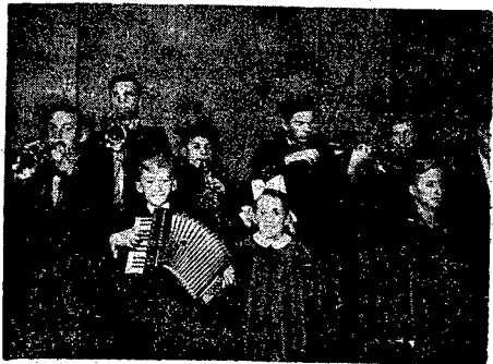
Grupa dzieci, biorąca udział w audycji radiowej...