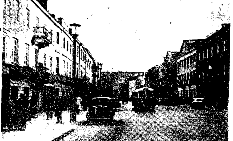
W niedzielę 9-10 bm. otwarty został w całości dla ruchu kołowego Nowy Świat. Otrzymał on nową nawierzchnię, oświetlenie, urządził się wzdłuż ulicy nowy pas zieleni. Wskazywane są nowe tabliczki drogowe, oznaczające kierunki. Wskazywane są nowe tabliczki drogowe, oznaczające kierunki. Wskazywane są nowe tabliczki drogowe, oznaczające kierunki.

W poprzednich rozmowach z naszymi Czytelnikami zajmowaliśmy się w ogólnym zarysie problemami gospodarczymi. Dziś chcemy przedstawić szerszy obraz sytuacji w naszym kraju w tym, co się dzieje w gospodarstwie narodowym i w stosunku do Związku Radzieckiego.